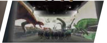
恐竜の世界を大迫力映像で再現 「特別展示室」※特別展開催時を除く