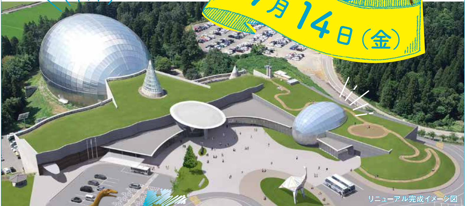
リニューアル完成イメージ図