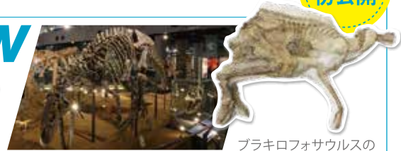
ブラキロフォサウルスの 実物ミイラ化石