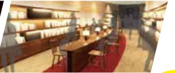
恐竜研究最前線の資料が満載 「ダイノライブラリー」