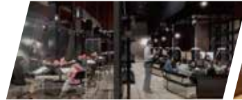
化石研究をリアルに体感 「化石研究体験」