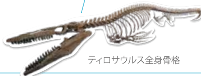
ティロサウルス全身骨格