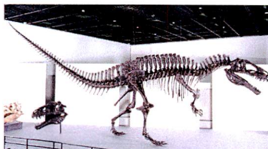
「アクロカントサウルス・アトケンシス」