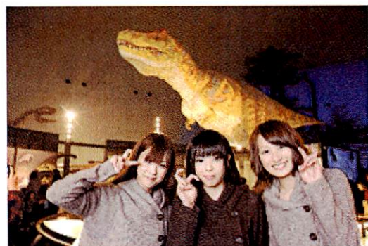
恐竜年(たつどし)プロジェクトキャンペーンガール 「恐竜ガールズ」