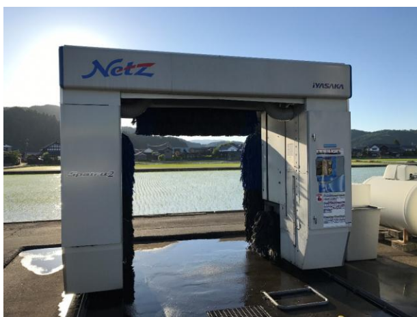
音楽堂いちばん店