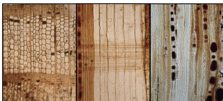
顕微鏡で見たスギの木材組織