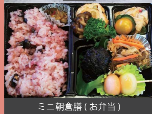
ミ二朝倉膳 (お弁当)