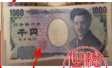
お札にきざまれている篆文