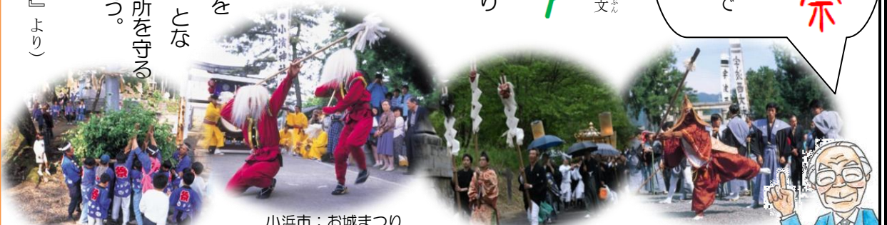
小浜市：お城まつり