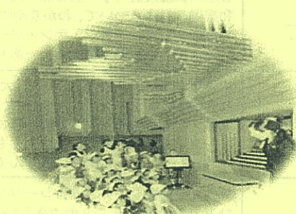
パイプオルガン見学ツアー