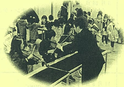
楽器体験 (ヴァイオリン)