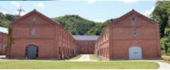
舞鶴赤れんがパーク Meitetsu Brick Park (舞鶴市) 高瀬マップ

旧海軍が建造した赤れんが倉庫群が立ち並び、ノスタルジックな雰囲気に溢れます。国の重要文化財にも指定されており、倉庫内では喫茶店や土産物販売のほか、展示やライブ、アートイベントが行われています。