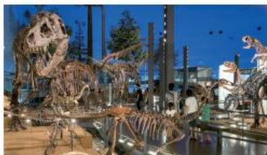
福井県立恐竜博物館 The Fukuoka Prefectural Dinosaur Museum (福山市) 高瀬マップ

恐竜化石の宝庫として全国的にその名が知られている福山市にある、世界有数の恐竜博物館です。広大な空間には、40体以上の恐竜骨格をはじめ、恐竜ロボットやジオラマなども多数展示されており、大人も子供も夢中になります。