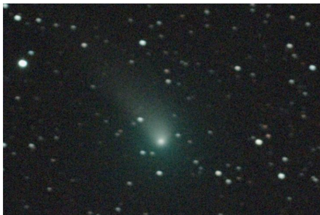
4月2日撮影のジョンソン彗星(8.4等級)