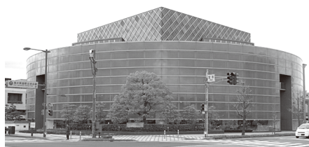
福井県国際交流会館 福井県福井市宝永3丁目1-1