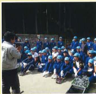
化石の発掘体験ができます