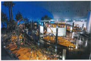
1F「恐竜の世界」 新たな全身骨格が増えています

教科書や資料集に掲載されている標本も展示しています (恐竜の全身骨格だけでも44体(うち実物10体)、その他の標本を含め約1,800点を展示)