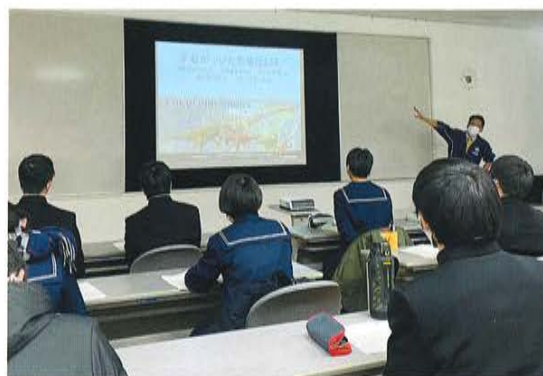
恐竜授業：福井の恐竜研究(SSH)