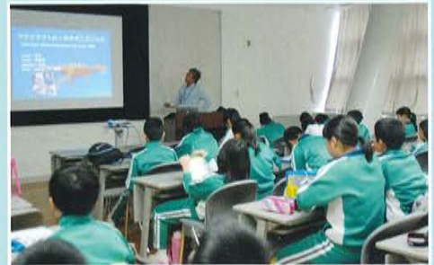
恐竜や地質などに関する授業です