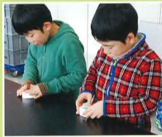
アンモナイトの消しゴム作り