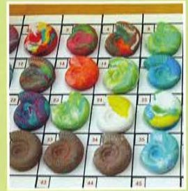
個性豊かなアンモナイトが できました！