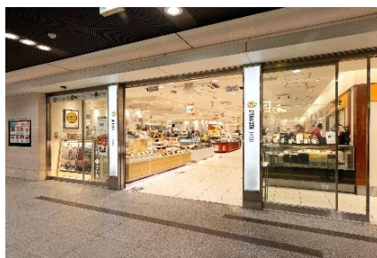
お弁当・惣菜エリア