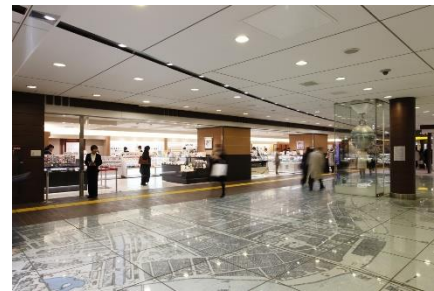
お土産・スイーツエリア