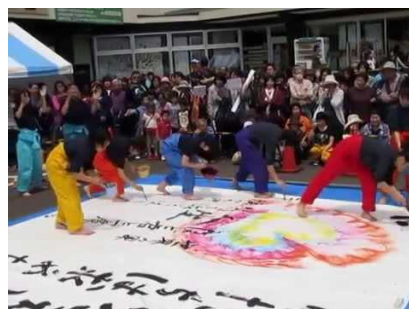
武生商業高校 HP より書道部活動状況