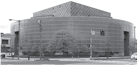
福井県国際交流会館 福井県福井市宝永3丁目1-1