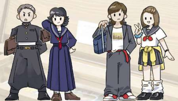
あの頃流行の制服