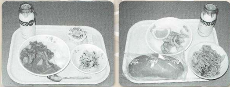
人気の給食メニュー(遠敷小学校100年史)