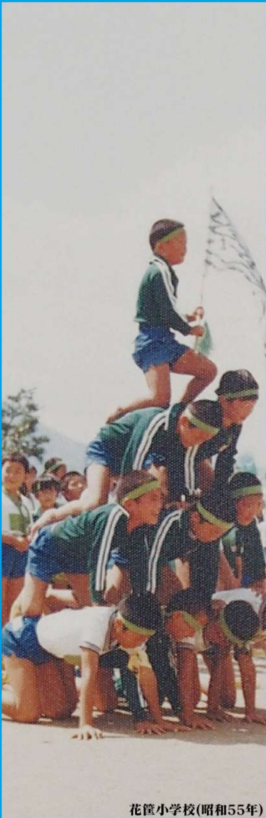
花筐小学校(昭和55年)