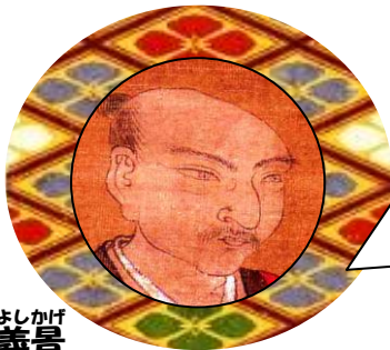
あさくらよしかげ 朝倉義景

↑せんごくだいまいよう 戦国大名のサインを「花押」といいます。 あなただけのオリジナル花押を書いてみましょう！