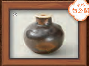
①木筒（付札）「御形様」墨書 朝倉館跡出土（当館蔵） ②黒漆塗総覆輪二十四間阿古陀形兜兜鉢 伝・朝倉義景所用（井伊美術館蔵、福井市立郷土歴史博物館寄託） ③朝倉義景画像（心月寺蔵、福井市立郷土歴史博物館寄託） ④朝倉太郎左衛門尉奉納瓦（広陸寺蔵） ⑤伝朝倉義景所持茶入（藤四郎丸壺茶入）（本能寺蔵） ⑥竹生島大聖院宛 朝倉義景書状（竹生島宝蔵寺蔵、長浜市長浜城歴史博物館寄託） ⑦初谷石製狛犬（十五社神社蔵）