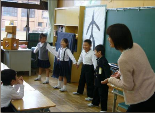
白川文字学を活用した楽しい漢字学習の授業