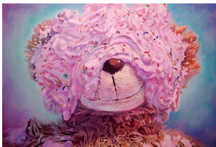
Cream and Bear, 2016, Acrylic on canvas