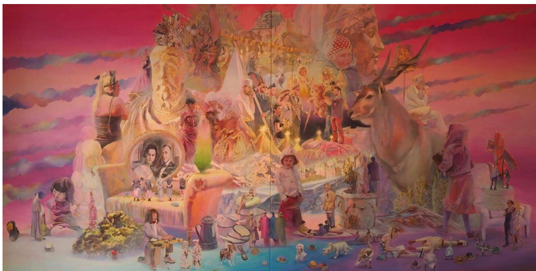
Milky Way, 2016, Acrylic on canvas