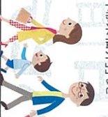
顔出しパネル記念撮影