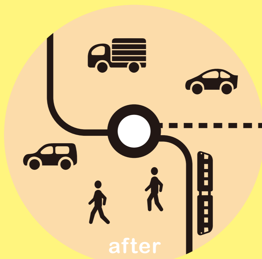
持続可能でスマートな 人間中心の都市構造へ