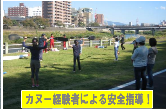
カヌー経験者による安全指導！