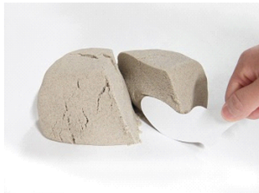
固まった砂も厚紙でサクッと切ることができます。