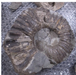
（左図）アンモナイトの化石

きれいならせん状に巻いた殻が特徴の、古代生物「アンモナイト」と、「アンモナイト」にそっくりな現存の「オウムガイ」との違いについて学べるコーナーです。外見だけではなかなかわかりませんが、殻の中にはどんな秘密がかくされているのか？これらが何の仲間なのか？などについて学べます。