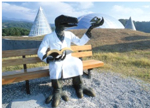
(左図) 特別展示ゾーンのパネル イメージ