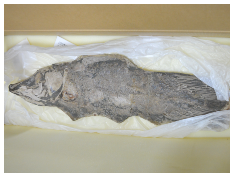
シーラカンスの仲間（アクセルロディクチス）

（※）硬骨魚類…骨格の大部分が硬骨で出来ており、浮袋があることなどが特徴で魚類の約90%以上を占める