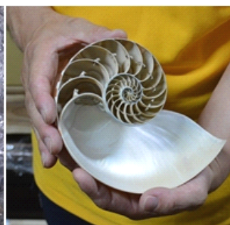
（右図）オウムガイの殻