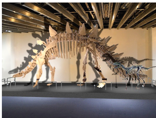
「トゥオジャンゴサウルス」の展示イメージ

また、直径約1メートルの巨大なアンモナイトの化石は、見るだけでなく実際に触れることができます。恐竜時代にタイムスリップしたくなるような特別な空間をお楽しみください。