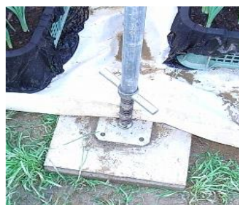
ジャッキ付きの台