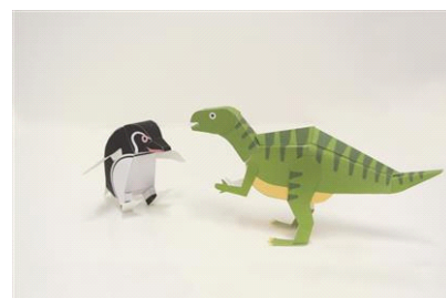
ペンギンと恐竜ペーパークラフト

開催日：2014年8月1日(金)～9月21日(日)の平日 開催時間：各日10時00分～17時00分(最終受付16時30分) 開催場所：5階 すみだステージ 参加定員：各日40名 参加対象：小学3年生以上 参加方法：当日申し込み 開催内容：『福井県立恐竜博物館』プロデュースのペーパークラフトワークショップを『すみだ水族館』で開催します。切り抜いて組み立てたら、自分だけのフクイサウルスが作れます。今回は、特別にペンギンのペーパークラフトとセットで作っていただけます。