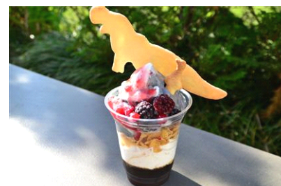
ペンギンもびっくり!? きょうりゅうパフェ

商品内容：ペンギンカフェの名物「ペンギンパフェ」と福井県立恐竜博物館の「ティラノパフェ」がコラボレーションしたパフェです。恐竜とペンギンのクッキーがのっています。