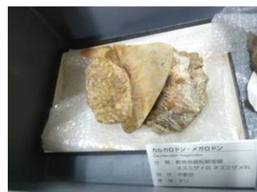
メガロドンの歯の化石標本

開催内容：実物の化石標本や福井県立恐竜博物館の研究員がピックアップした恐竜に関する書籍などを設置します。夏休みの自由研究にぴったりです。