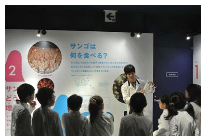
恐竜研究員のガイドツアー ※イメージ画像

開催日：2014年8月19日(火) 開催時間：〔子ども向け〕11時00分～12時00分 〔大人向け〕19時30分～20時30分 開催場所：館内各所 参加定員：各回20名 参加方法：事前募集 ※詳細は公式ホームページでお知らせします。 開催内容：福井県立恐竜博物館の研究員が、各種骨格標本を解説する特別なガイドツアーです。