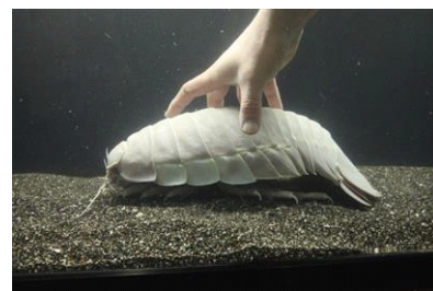
ダイオウグソクムシ

開催内容：オウムガイやカブトガニなど、古代よりあまり姿が変わっていない水生生物の展示を行います。