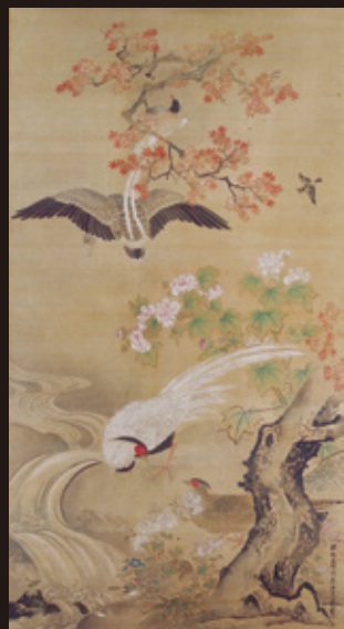
狩野探幽筆「四季花鳥図」(秋) 江戸時代・寛文12年(1672)