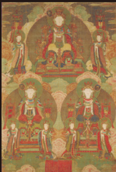
【県文】「三帝釈天像」 朝鮮王朝時代・成化19年(1483)