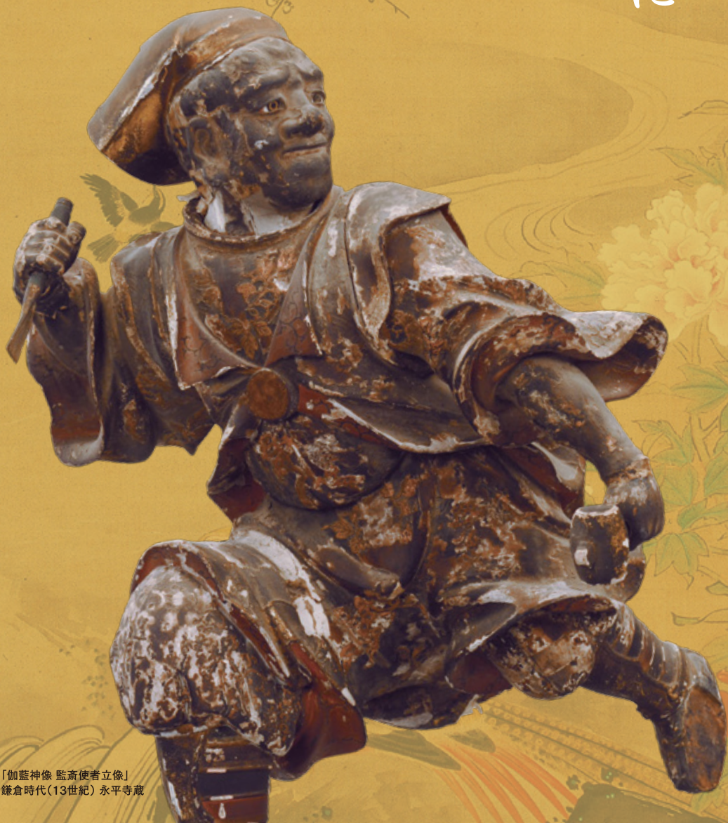
〔伽藍神像 監斎使者立像〕 鎌倉時代(13世紀) 永平寺蔵