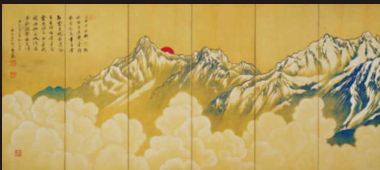
寺崎廣業筆「ヒマラヤ図」大正8年(1919)

福井県立美術館、JTB各店舗、コンビニ端末/ローソン、ファミリーマート、セブンイレブン、サークルKサンクス