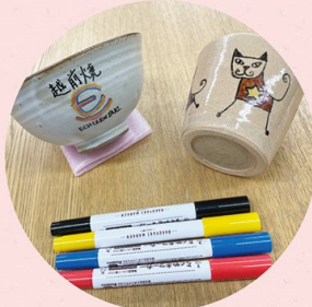
越前焼の絵付け体験 (カップ)