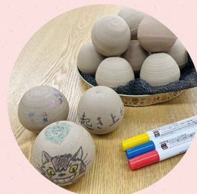
越前焼の絵付け体験 (起き上がりこぼし)