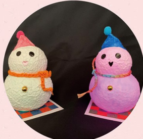
越前和紙の雪だるまをデコレーション