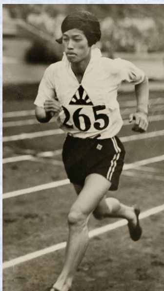
人見 絹枝 選手 (日本人女性初の 五輪メダリスト)

今回の展示では、国語や英語、道徳などの教科書に取り上げられたオリンピックやパラリンピック選手や大会でのエピソードとともに、戦争の犠牲となった選手についてもご紹介します。