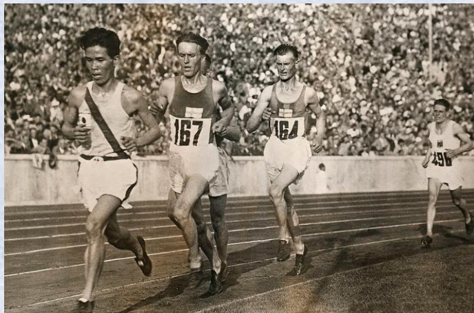
村社 講平 選手 (ベルリン五輪 5000m, 10000m 4位)