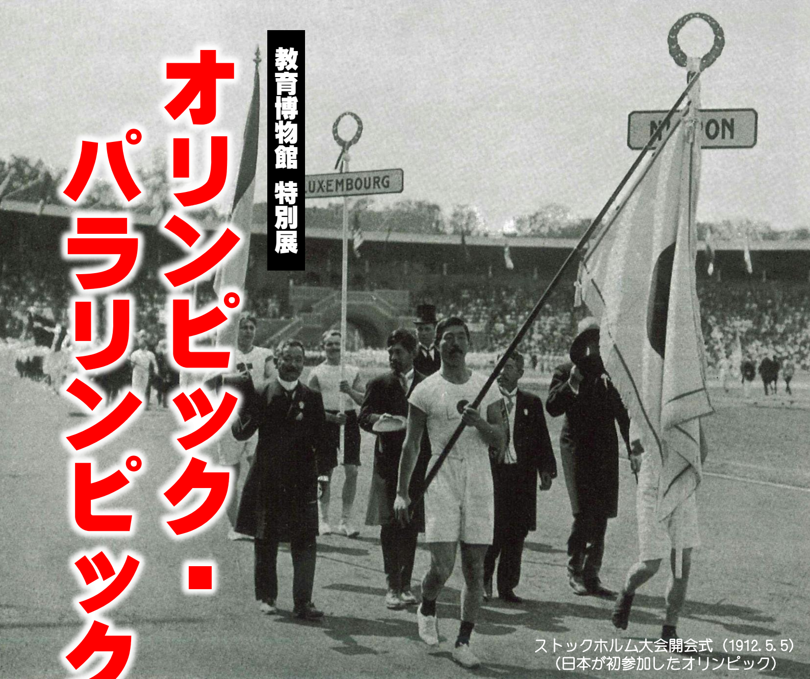
ストックホルム大会開会式 (1912. 5. 5) (日本が初参加したオリンピック)