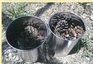
松ぼっくりや小枝を 缶カンに入れます。