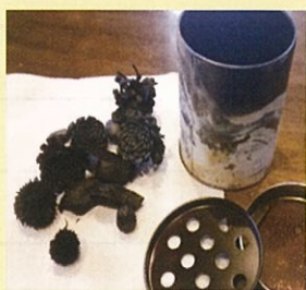
木炭の出来上がり。