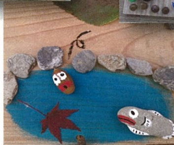
写真は、イメージです。