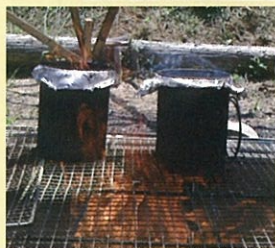
30分ほど 薪でしっかりと 焼きます。