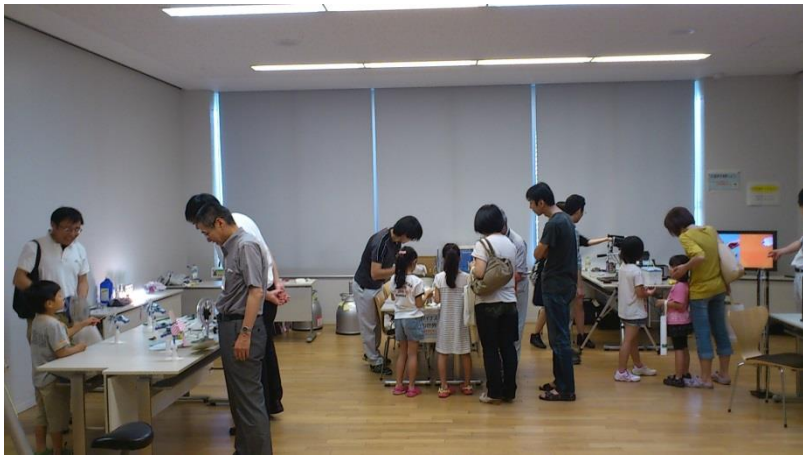
<体験コーナー全景>