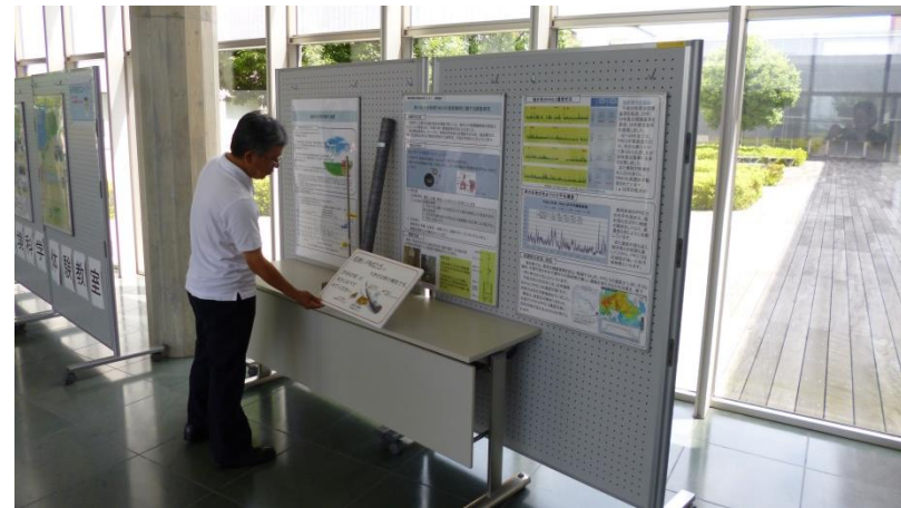
<研究紹介パネル展示>