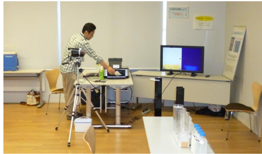
<サーモカメラ撮影>