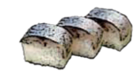
さば寿司といえば「バヤ焼き」ですが…