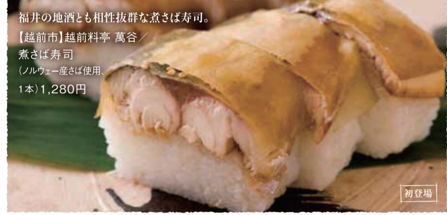
福井の地酒とも相性抜群な煮さば寿司。 【越前市】越前料亭 萬谷 / 煮さば寿司 (ノルウェー産さば使用) 1本1,280円