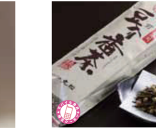
【福井市】お茶の老舗 丸松 / 豆入番茶ほうじ仕上げ(1袋・300g入)……………1,080円