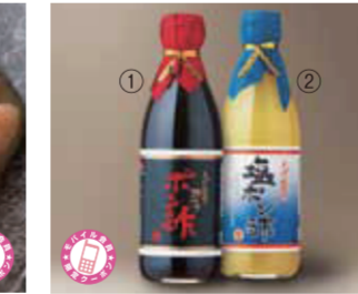
【小浜市】とば屋餅店 / ①味つけボン酢 ②塩ボン酢 各540円(ともに360ml)