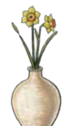
一輪挿しといえば「焼物・陶器」ですが… 福井では「天然の爆竹」!

気温が低く日持ちがいい冬に作り、正月に里帰りの土産にしたことが由来という説も。現在では暖かい部屋で爽やかな喉越しを楽しむスタイルが福井流です。