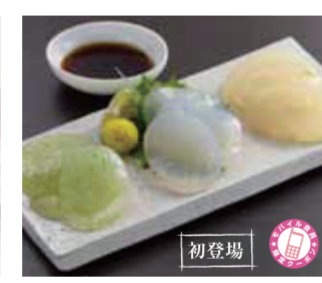
【福井市】まるたけこんやく / 禪の生さしみこんやく(青・生姜白)(各150g)……………各432円