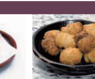
【大野市】吉村甘露堂 / しょうゆ鬼っ子(1袋・120g)324円 サラダ鬼っ子(1袋・120g) 324円