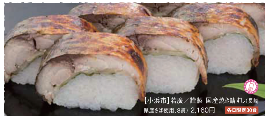
【小浜市】若狭 / 謹製 国産焼き鯖すし(長崎県産さば使用、8貫) 2,160円 各日限定30食