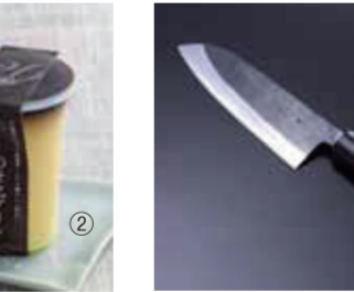
【越前市】鍛冶工房いらい / 本鍛造黒打 三徳包丁(長さ16.5cm)……………14,040円