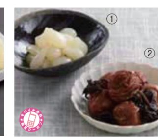
【三方上中郡】JA敦賀美方 梅の里会館 / ①三平子 花ちっさよ(福井県産、80g)291円、②福井干ししほ汁(ホト)福井県産、350g)1,080円