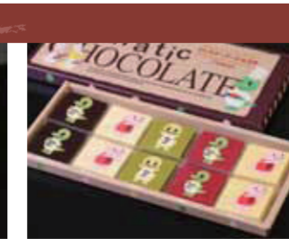
【坂井市】西洋菓子倶楽部 / [写真]ジュラックショコラ(10枚入)651円、福ぼろり(20個入)551円