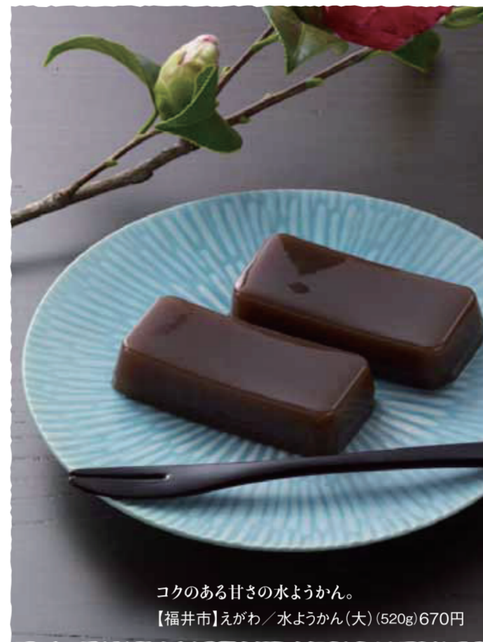
コクのある甘さの水ようかん。 【福井市】えがわ / 水ようかん(大) (520g) 670円

マークは、モバイル会員限定クーポン対象店舗。 ※クーポンは会期前日に公開いたします。 【お食事処】 営業時間:午前11時~午後7時 ※最終日は午後4時まで。 ラストオーダーは各日お食事処閉場の30分前まで