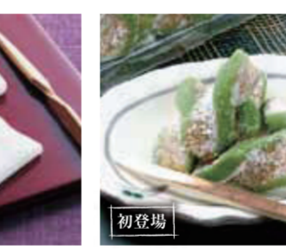
【越前市】朝倉製菓 / 青ねじ(16個入)……………432円