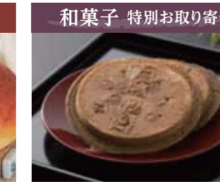
【坂井市】五月ヶ瀬 / 五月ヶ瀬 煎餅(4枚入)……………368円