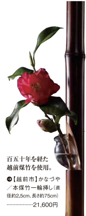
百五十年を経た越前爆竹を使用。

【越前市】かなづや / 本爆竹一輪挿し(直径約2.5cm、長さ約75cm)……………21,600円