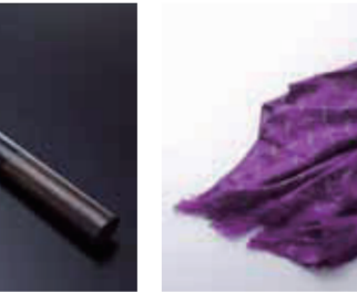
【丹生郡】協和テキスタイル / 銀世界マフラー(絹・毛・ナイロン[銀メッキ加工]、120×120cm)……………9,720円