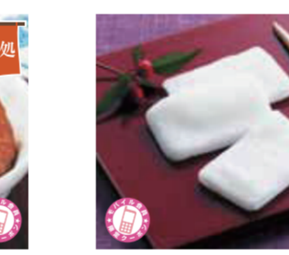
【福井市】羽二重餅本舗 松岡軒 / 羽二重餅(1箱・20枚入) 735円