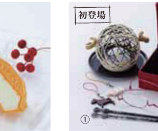
【鯖江市】鯖江ギフト組 / ①サバエミカキ 各4,212円、②ペーパーグラス……………15,660円、③時計 38,800円 ほか