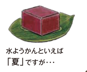
水ようかんといえば「夏」ですが…