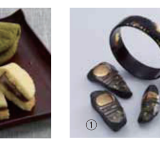
【鯖江市】松田時絵 / ①石箸置(5個入)21,600円、②ベッ甲プレス(直径約7.4cm)97,200円