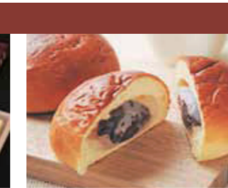
【鯖江市】ヨーロッパバンキム / 大福あんぱん(1個)……………221円