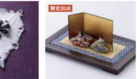
【越前市】高嶋木工所 / ちっちゃなたたみ花台・飾台(雛人形付)(ウールナット材、指物、天然漆塗り)天然漆仕上げ、約厚15×幅24×高さ15cm) 10,800円