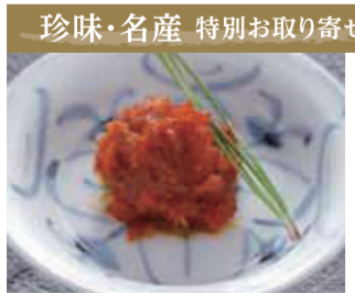
【福井市】天かつ / 越前仕立て汐雲丹(23g、プラスチック容器入)3,240円