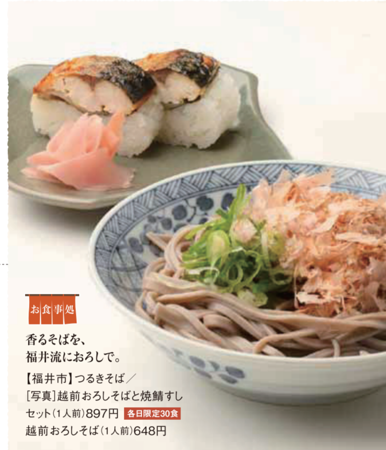
【お食事処】 香るそばを、福井流におろして。

鯖街道の歴史に育まれ、時代を超えて愛されるさば料理。じっくりと焚きあげ、さばの旨みを凝縮させました。香りとともに旨みがひらく料亭の煮さば寿司をご堪能ください。