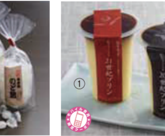
【鯖江市】メゾン・ド・レトワール / ①21世紀プリン(95ml)……………361円 ②20世紀プリン(95ml)……………331円