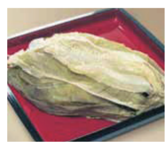
【敦賀市】北前船のカワモト / むき込おぼろ(110g)……………1,080円