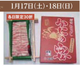
【敦賀駅】塩荘 / 越前かにし(かにの要(スライニ)福産産、1折)1,100円