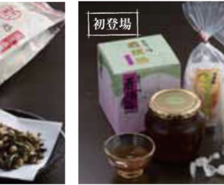
【小浜市】若狭餅本舗 大入号 / 若狭餅 レンコンオリゴ糖漬(1箱・600g入)4,320円 ほか