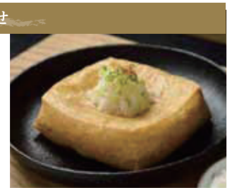
【坂井市】谷口屋 / 谷口屋の、おあげ(1枚)……………540円