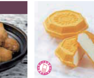
【南条郡】こう太郎のあいす屋さん / 生乳アイスもなか(50g)221円