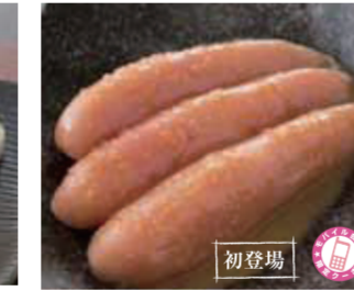
【福井市】まるいちつづま本舗 / 雲丹 醤油のたい(スケウダラの子ロアまたはアメリカ産、うにチリ産、1本・120g)1,080円