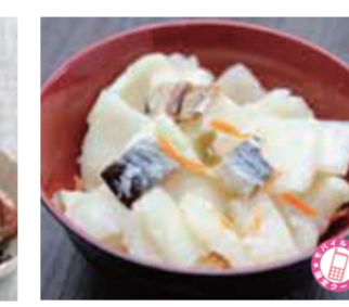
【敦賀市】徳兵衛商店 / 大根すし(200g)……………648円