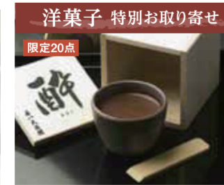
【福井市】森八大名園 / [写真]酔(木箱入、越前焼い・呑み1個入)2,376円、ききちよ(利き酒用豆麹口2個入)1,836円(限定30点)