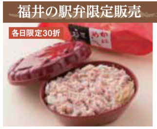
【福井駅】香匠本店 / 越前かにし(皿)スライニ・福産産、スワ(カナダ産使用、1折)1,151円