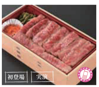
【鯖江市】ミート&デリカさき / 若狭牛サーロインステーキ重(1折)……………2,700円