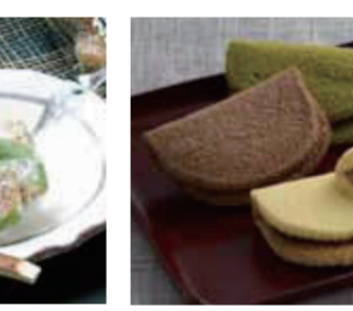
【越前市】笹屋茶舗 / 羽二重巻(プレーン・抹茶・こごあ)(各1個)……………各152円