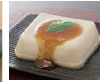
【福井市】大本山永平寺御用達 米又 / 永平寺 生胡麻豆腐(115g×2、みそだれ付)……………648円