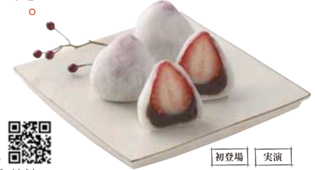
羽二重餅の中に、紅ほっぺとこし餡。 【福井市】村中甘泉堂 / 羽二重いちご稚児のほっぺ(1個)……………206円