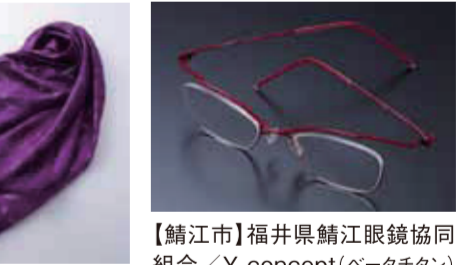
【鯖江市】福井県鏡協同組合 / Y-concept(ベータチタン)……………41,040円(フレーム代のみ) ※レンズをお作りする方は、会期中、7階 催事場にて検査・調整が必要となります。または処方箋をお持ちください。