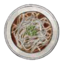
そばに絡めるといえば「つゆ」ですが…

日本酒Bar特設 ■7階=催事場内 会期中、きき酒師が福井の銘酒を有料でご提供いたします。