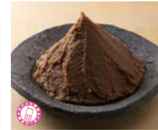
【福井市】米五のみそ / 大本山永平寺御用達「蔵」(500g)519円