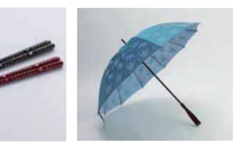
【福井市】福井洋傘 / ジャガード織 ゆり 雨用長傘(60cm×12カラーボンファイバー骨)……………32,400円