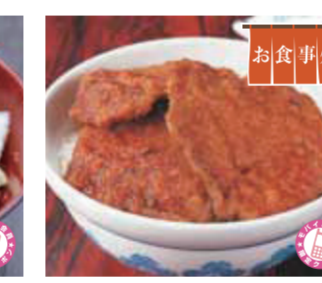
【福井市】ヨーロッパ軒総本店 / ソースカツ丼(1杯)……………880円