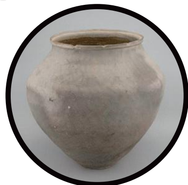
加賀焼 《牧口墳墓出土幾何文大甕》 14世紀 小松市立博物館蔵