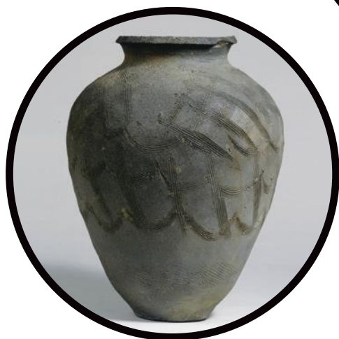
珠洲焼 《櫛目袈裟澤文壺》 13世紀 珠洲市立珠洲焼資料館蔵

石川県を代表するこれらのやきものが持つ歴史と美しさはもとより、常設展示室で展示している越前焼もあわせてご覧いただき、福井・石川両県のやきものの魅力に触れてください。