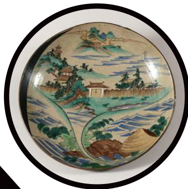
正院焼 《正院色絵蟹気楼図大平鉢》 19世紀 珠洲市立珠洲焼資料館蔵