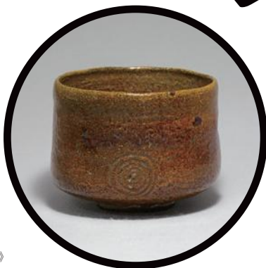
大樋焼 初代大樋長左衛門 《大樋胎釉渦紋茶盤 銘「玉甕」》 大樋美術館蔵