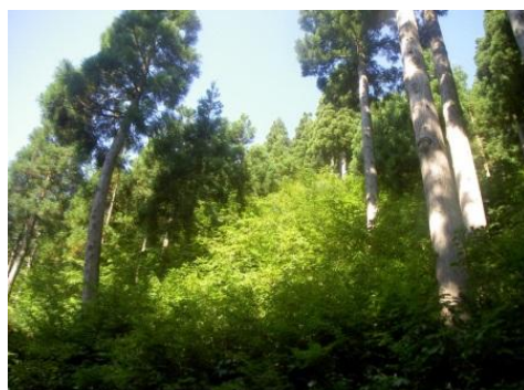
スギ林内の広葉樹侵入状況