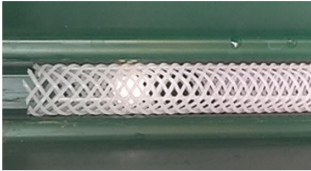
モノフィラチューブ