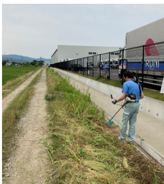
会社周辺の草刈り作業②