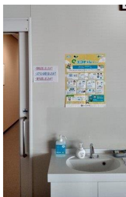
チラシの掲示（休憩所）