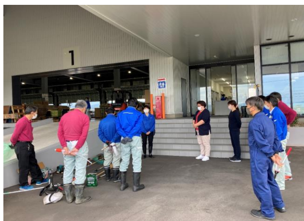
会社周辺の草刈り作業①