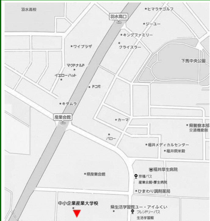
中小企業産業大学校 (福井市下六条町 16-15)