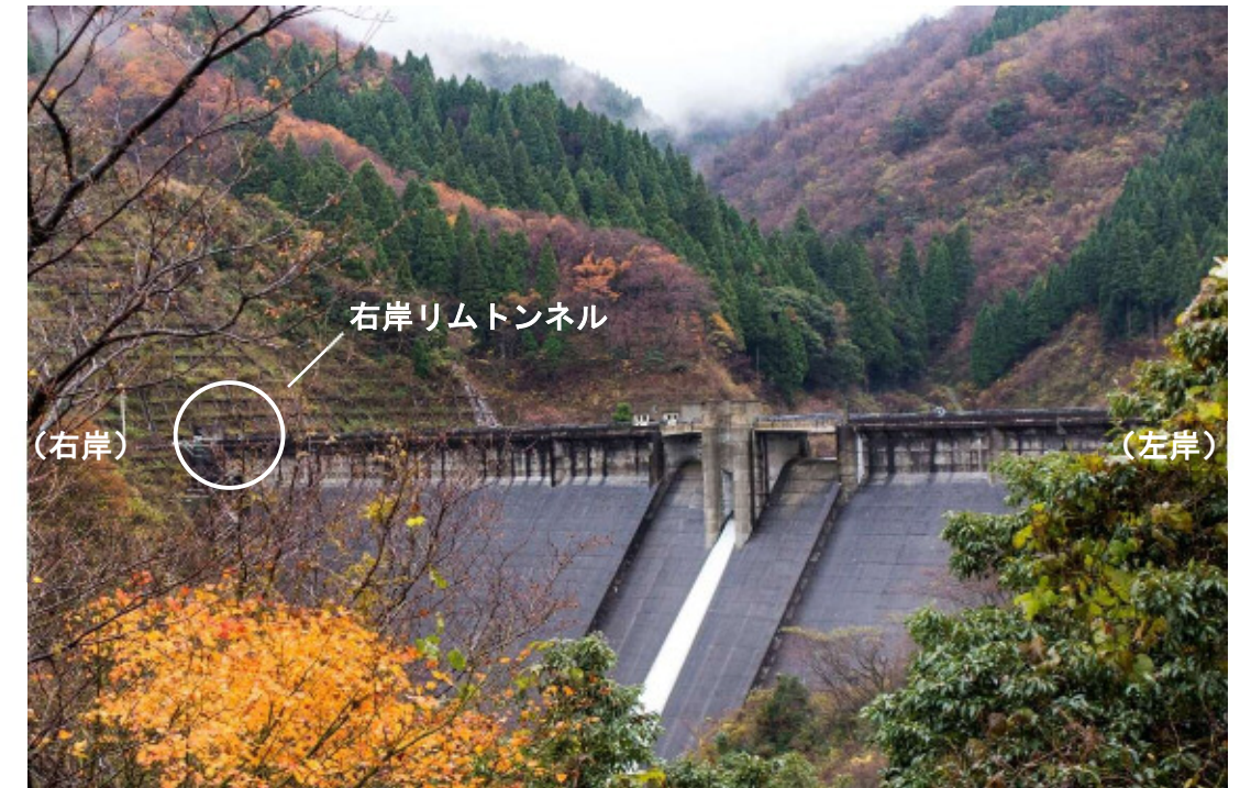
-永平寺ダム(左岸下流より望む)-