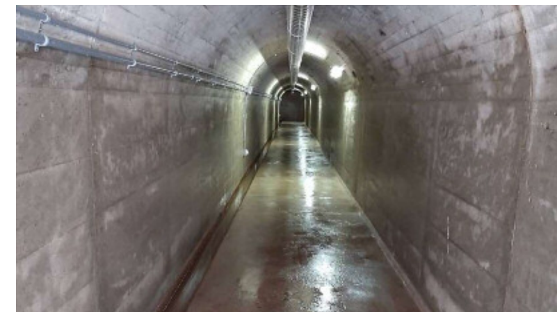
-リムトンネル内状況-