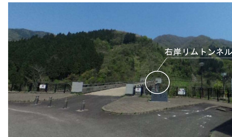
-リムトンネル(左岸上流より望む)-