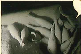
沈没船から見つかった、約170年前のシャンパン