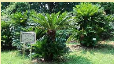
池野が精子を発見したソテツ(分株) (東京大学小石川植物園)