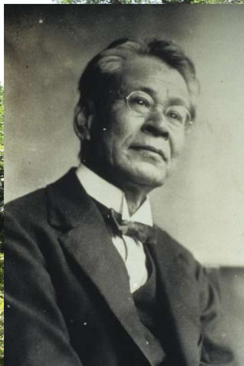
1500種類以上の植物を命名した 日本の植物分類学の父 牧野富太郎