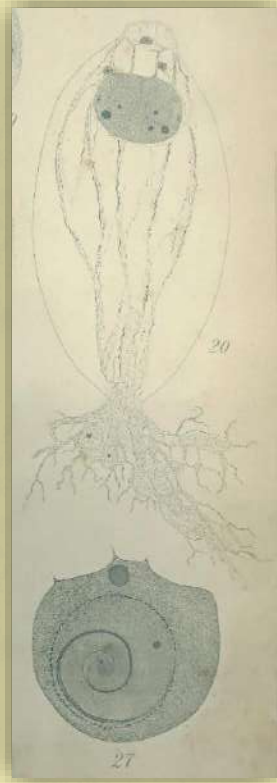
平瀬が描いたイチヨウの観察図 (上は花粉管と中央細胞 下は精細胞)