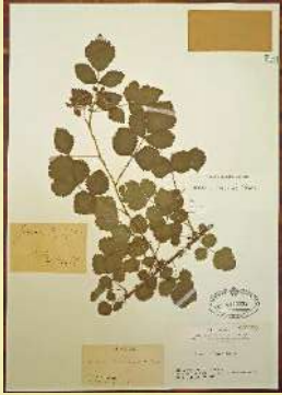
平瀬が採集し、牧野が命名したオオトックリイチゴの標本 (写真) 高知県立牧野植物園蔵