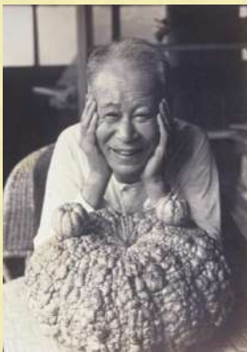
77歳の牧野 1939(昭和14)年

今回の特別展では、平瀬作五郎の偉業と生涯を中心に、牧野や池野など、平瀬を取り巻く学者たちの業績についても紹介します。