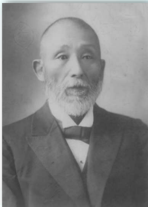
世界に先がけイチョウの 精子を発見した 平瀬作五郎