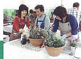
寄せ植え講座イメージ