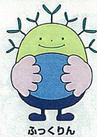
ふっくらん 緑と花の県民運動

今大会は、豊かな自然と歴史を有するおおい町で開催することにより、地域住民と来訪者が一体となった体験型イベントなどに参加し、木や花と触れ合うことで、「元気な森 元気なふるさとづくり」の理念を未来に引き継いでいくとともに、県土の緑化に対する意識の高揚を図ることを目的に開催します。