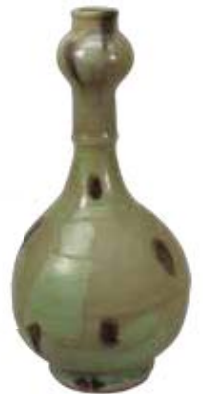
せいじてつばんもんつぼ 青磁鉄斑文壺