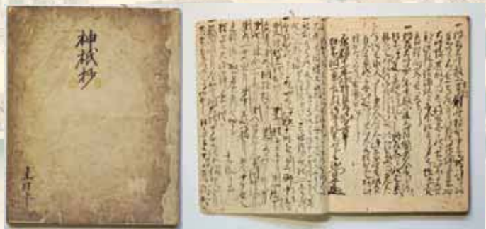
じんぎしょう 神祇抄 新発見 初公開資料

天文24年(1555)9月27日に加賀粟津口で合戦があったことを示す唯一の資料。感状は花押のみを据えた尊大な様式で書かれることが通例だが、本資料は署名と花押の両方が書かれており大変珍しい。