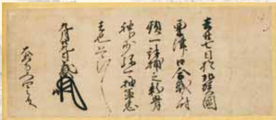
あさくらしかげかんじょう 朝倉義景感状 新発見 初公開資料

この他、一乗谷の日蓮宗寺院で学問が盛んであったことを示す教義書『神祇抄』[永禄11年(1568)一乗谷で書写]や、戦国時代の立花や座敷飾りの作法を記した『立花伝書』等の新出資料を、文芸・遊芸盛んな様子を物語る出土資料とともに公開します。