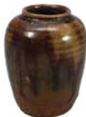
てつゆうちやいれ 鉄釉茶入