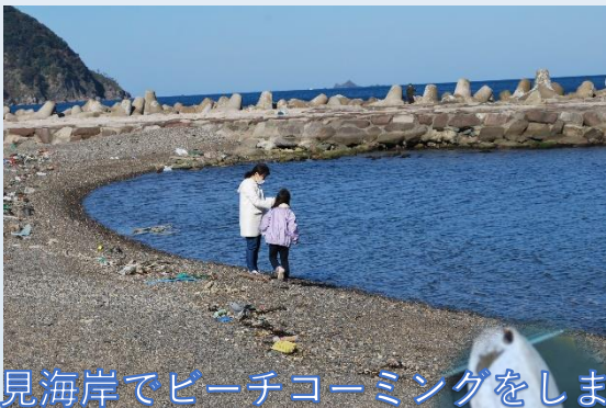
食見海岸でビーチコーミングをします。

【主催】福井県海浜自然センター 【連携】福井ライフ・アカデミー、福井大学C S T