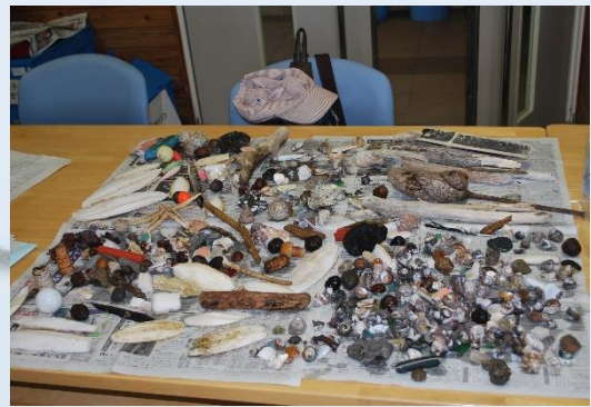
拾ってきた物を洗って乾かします。