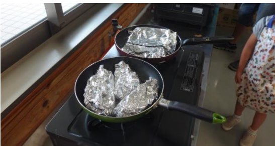
ホイルに包んで焼きます。