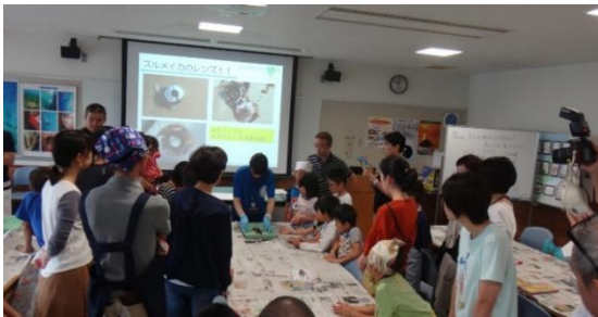
イカの体の仕組みを説明します。