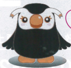
北方領土問題 広報キャラクター

北方領土は、日本人によって開拓され、1945年には1万7千人余りの日本人が居住していました。しかし、終戦直後ソ連軍により不法に占拠され日本人の住めない島々になってしまいました。北方四島は歴史적으로見ても1度も外国の領土となったことのない、我が国固有の領土です。我が国は一日も早く北方四島の帰属の問題を解決して、平和条約を締結することを目指しています。