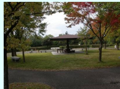
エントランス広場