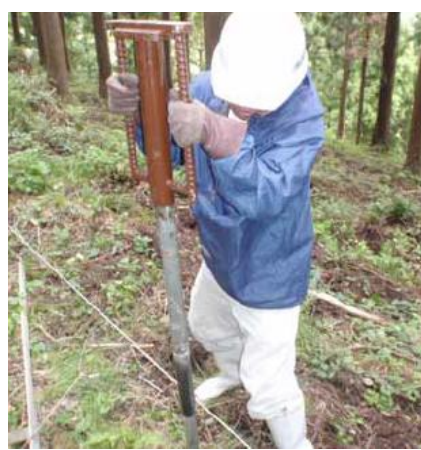
従来の杭打ち作業 (約60秒/本)