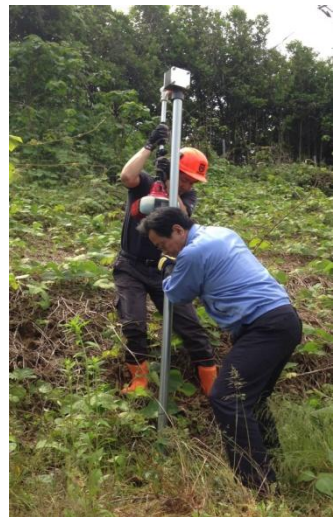
杭打機による杭打ち作業 (約5秒/本)