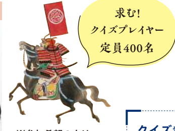
林輝幸 (クイズプレイヤー)