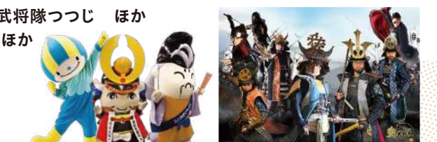
やまがた愛の武将隊(10日)