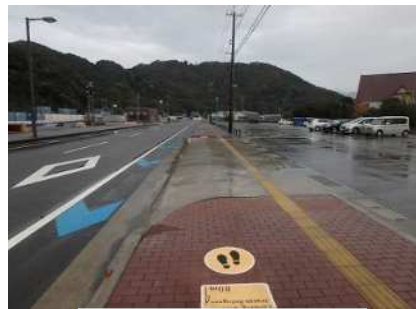
点字ブロック設置