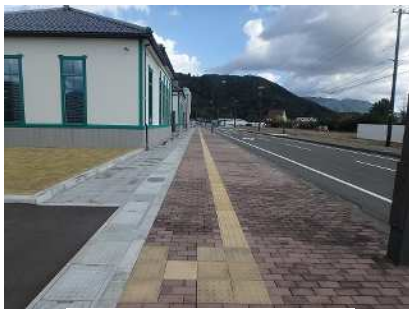
点字ブロック設置