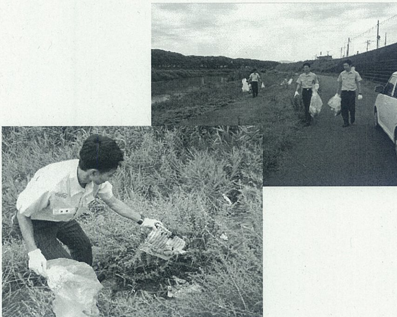
北陸コカ・コーラボトリング 美化活動（H25年9月7日） 足羽川河川敷にて