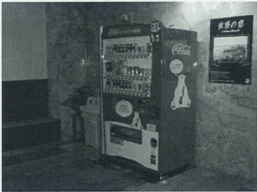
ピークシフト自販機設置の様子