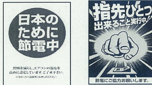
建屋内コンセント付近に貼り付け