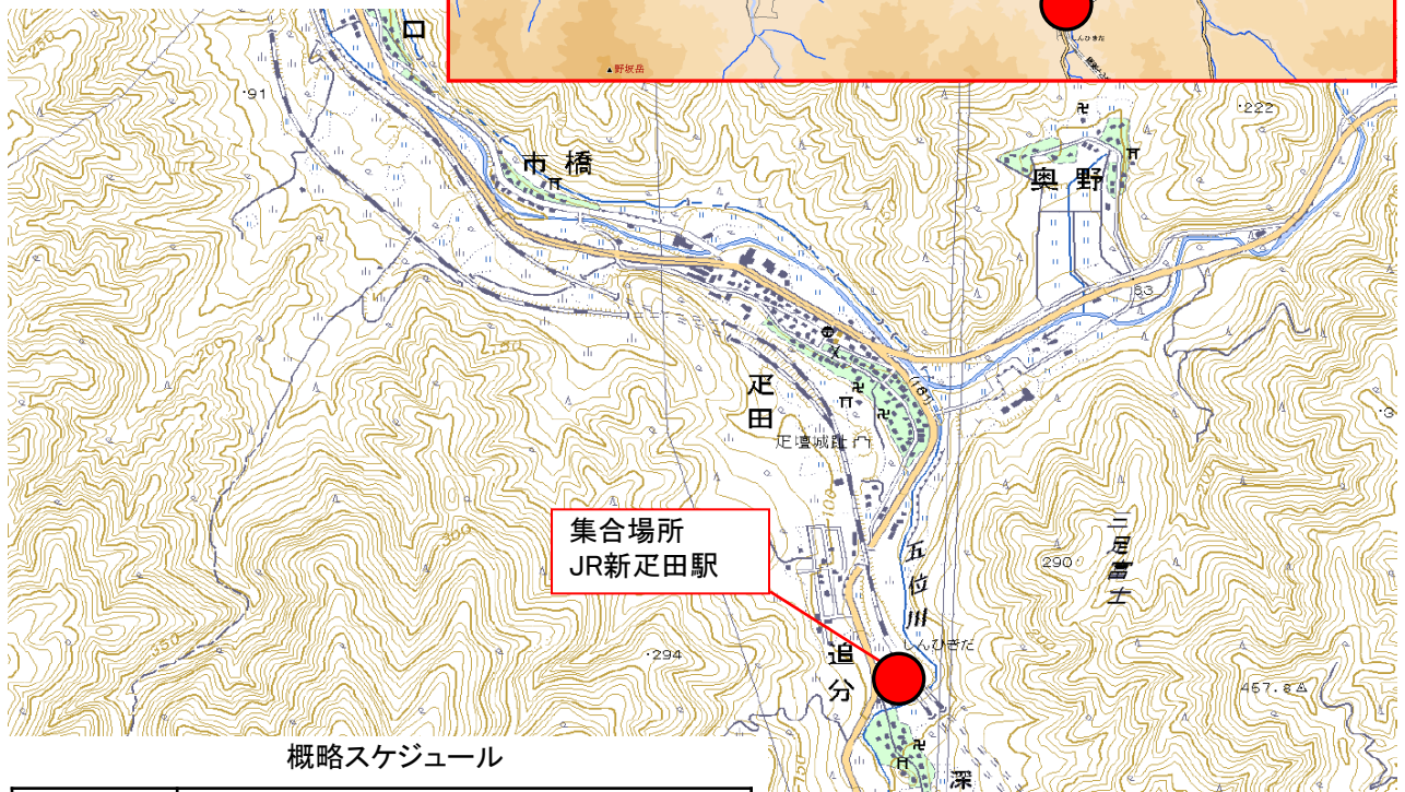
概略スケジュール