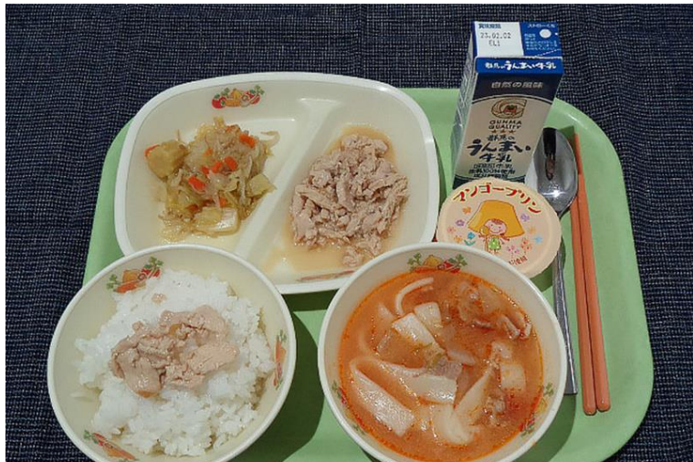
2023年1月18日。群馬県沼田市学校給食センター