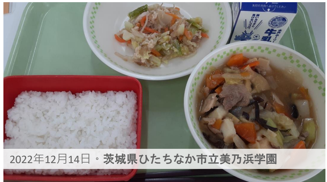
2022年12月14日。茨城県ひたちなか市立美乃浜学園