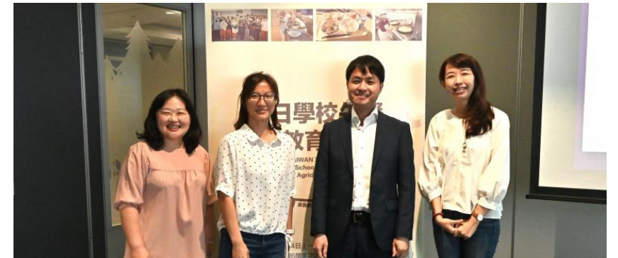
2023臺日學校午餐與食農教育分享會・曾參與計劃的臺日營養師於會場進行分享後留影。

給食スタッフの分配、調味料、食材の使用など、さまざまな国の学校給食の慣行について学びます。学校の栄養士がメニューを刷新するよう促します。