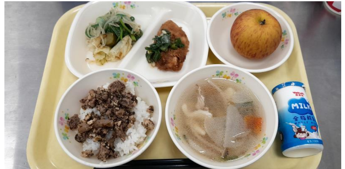
雲林県建国中学校が群馬の学校給食を提供