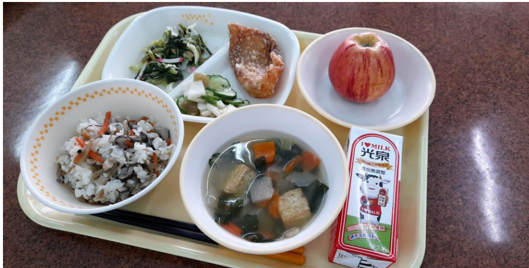
南投県での群馬県川場村の学校給食の試食