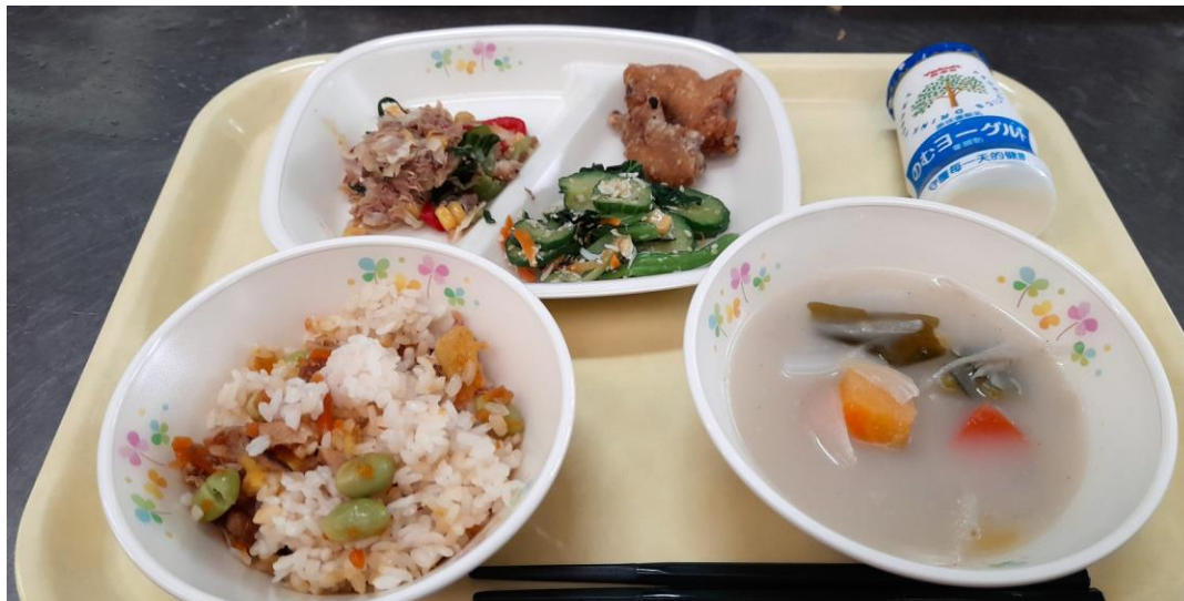
茨城の学校給食が鹿東小学校に