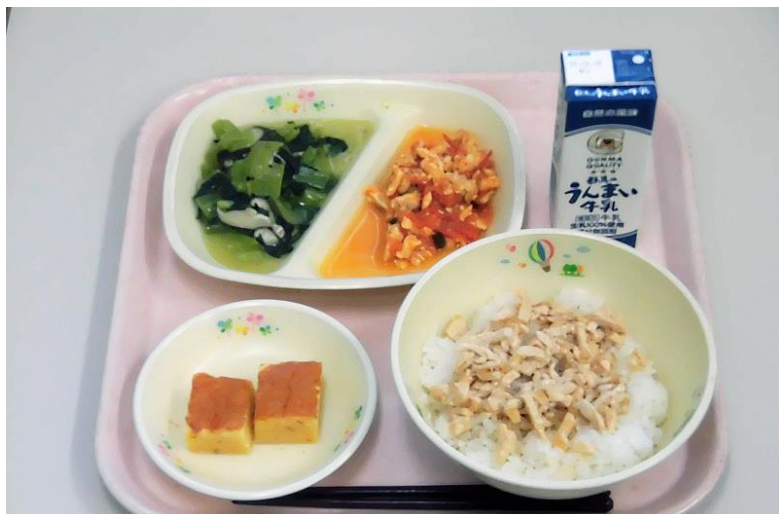
2022年11月25日。茨城県ひたちなか市立美乃浜学園