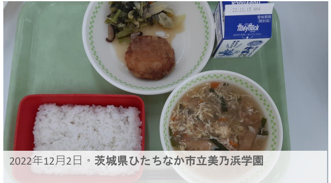
2022年12月2日。茨城県ひたちなか市立美乃浜学園